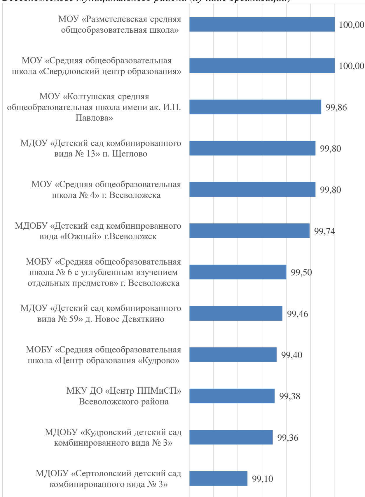
Гистограмма 1. Итоговый рейтинг по результатам сбора, обобщения и анализа информации о качестве условий оказания услуг организациями, осуществляющими образовательную деятельность на территории Всеволожского муниципального района (лучшие организации)